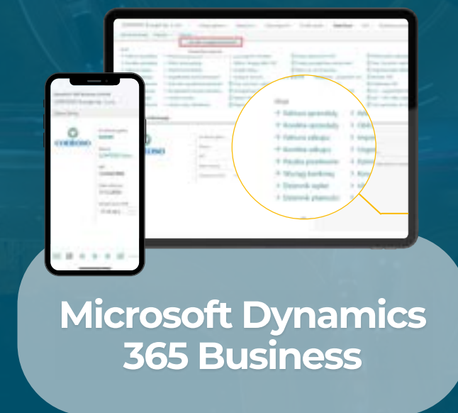
Microsoft Dynamics 365 Business