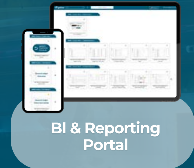
BI & Reporting Portal

DIGITALISIERTE BUCHHALTUNG UND PERSONALWESEN