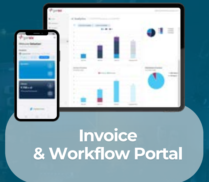
Invoice & Workflow Portal